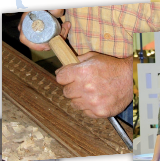
Porteurs de projets ayant bénéficié d'un accompagnement.